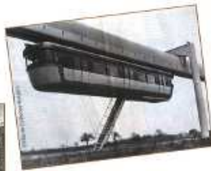
▲ Un projet de métro suspendu passant par Châtenay-Malabry a été envisagé (extraît de la revue générale des techniques > I&L La Génie Civil, 1964, Archives Communales de Châtenay-Malabry, cote 1025-3).

Pour répondre au succès de l'exposition sur les modes de déplacements des Châtenaisiens depuis 1841, présentée au mois de septembre au Pavillon des Arts et du Patrimoine, elle reprend le mercredi 18 octobre, pour un mois.